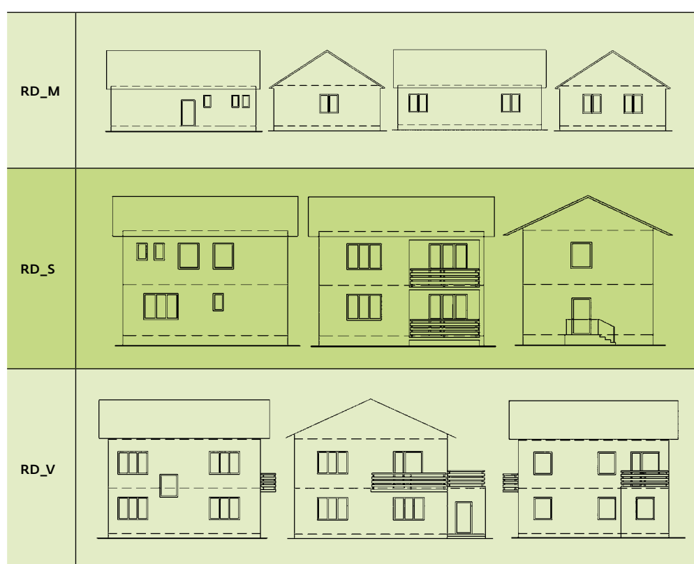
TAB. 7: Geometria referenčných rodinných domov (pohľady)

*označenie typu veľkosti M,S,V = Malý, Stredný a Veľký rodinný dom