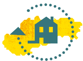
Graf 1: Percento obnovených rodinných domov

Nekvalitné budovy sú na Slovensku zodpovedné za zhoršené zdravie a teda aj produktivitu obyvateľov. Až pätina domácností hovorí, že má nekvalitné bývanie a tieto domácnosti zároveň uvádzajú 1,5 – 2,9 násobne častejšie zdravotné problémy. Vykurovanie nekvalitných (energeticky neekonomických budov) tuhým palivom (spolu s dopravou) významne (viac ako priemysel) prispieva k vzniku smogových situácií v mnohých častiach Slovenska. Smog ešte viac ničí zdravie a obmedzuje produktivitu obyvateľstva. Vykurovanie tuhým palivom zodpovedá za viac než 3 tisíc predčasných úmrtí na Slovensku ročne.